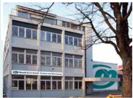
Gebäudeansicht Seite Ostermundigenstrasse