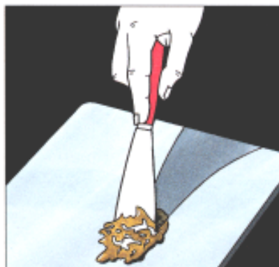
Mit dem Spachtel vermischt man die Härter- und die Füllmasse und verarbeitet sie anschliessend